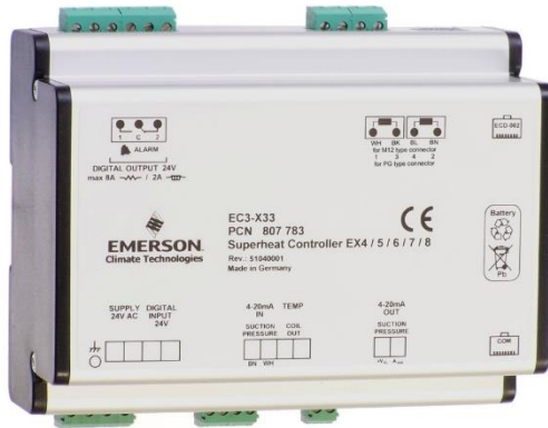
EC3-X32/33/62/63 + EC3-P32/33